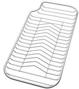
不锈钢背板 8100 115